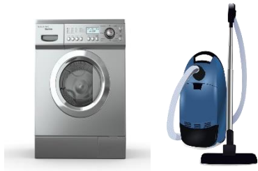
Limpieza del hogar y su entorno

➔ Somos parte de los 34.7 millones de hogares, en los que hoy, ante la necesidad del aislamiento domiciliario, participamos con: