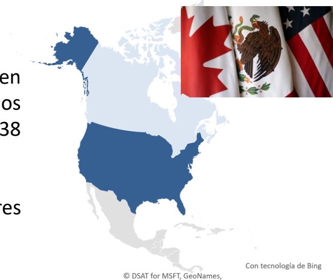
Estimación de exportaciones, mayo-junio 2020 a Estados Unidos y Canadá Millones de pesos

➔ Más de 19 millones de Enseres en los hogares de México.