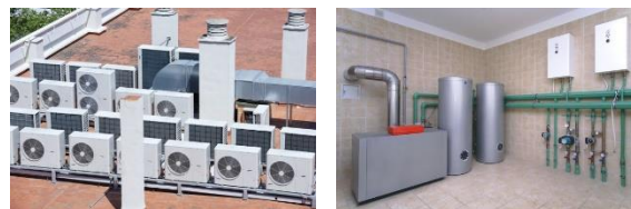
Calderas y climas en hospitales y centros médicos