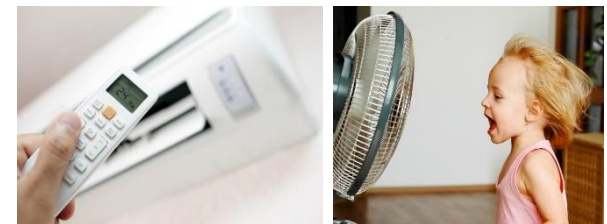
Climatización y ventilación