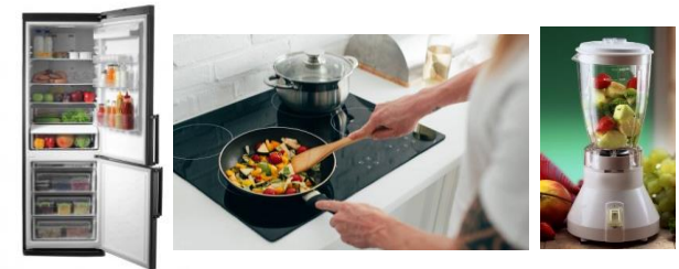
Conservación y preparación de alimentos